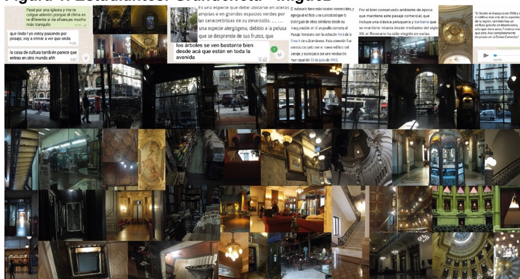
Figura 1. Estudiantes: Grandenetti - Iñiguez