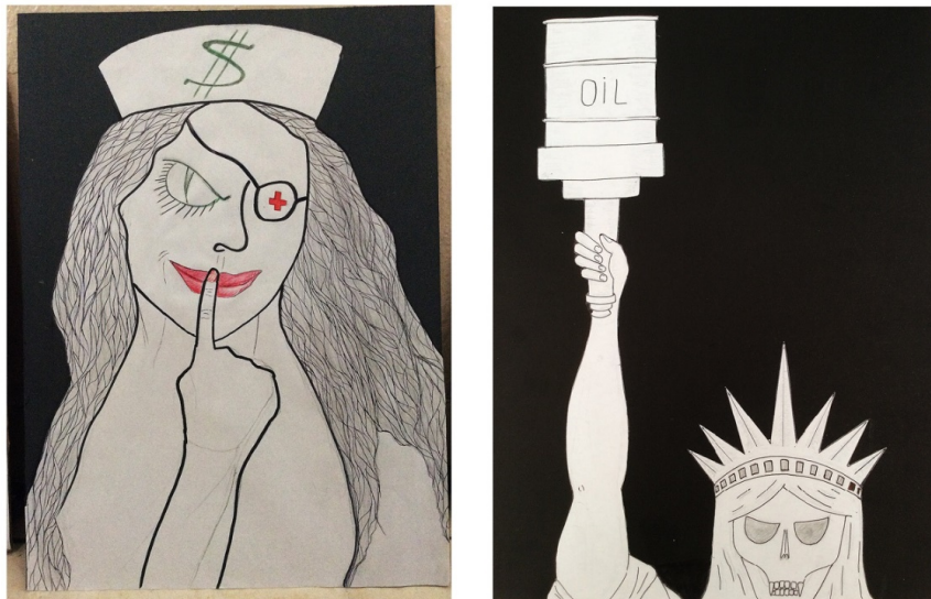
Figura 5. Mujeres e intericonicidades

Página Coco Cerrella. Taller en la cárcel, en https://coco.com.ar