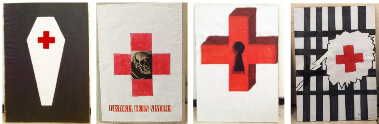
Figura 1. Derecho a la salud

Página Coco Cerrella. Taller en la cárcel, en https://coco.com.ar