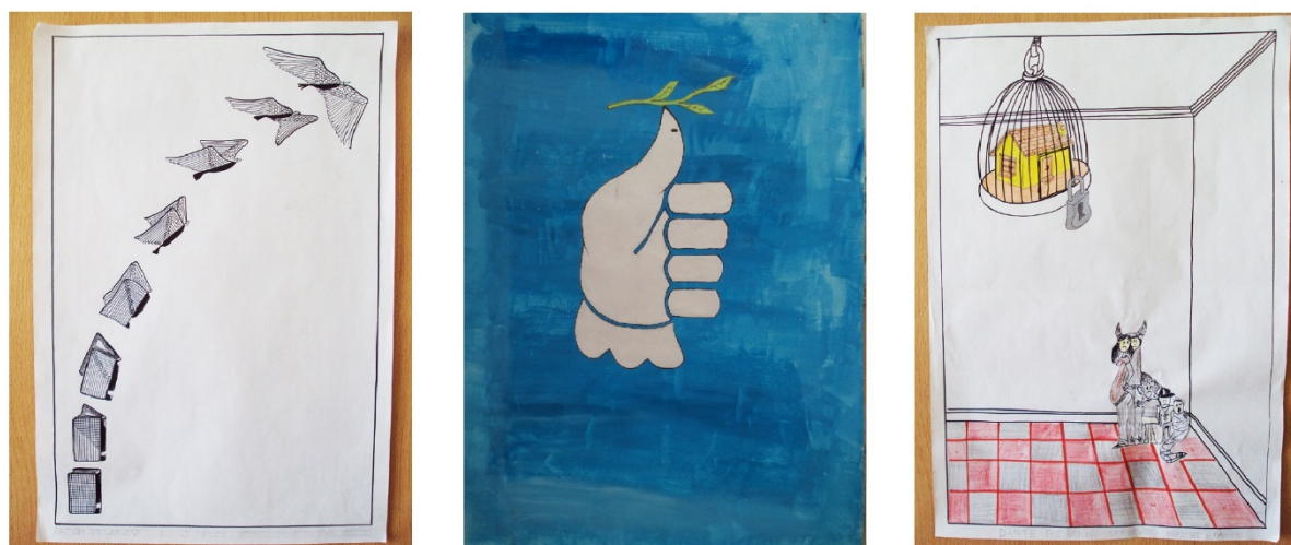
Figura 4. Las aves y su simbolismo

Página Coco Cerrella. Taller en la cárcel, en https://coco.com.ar