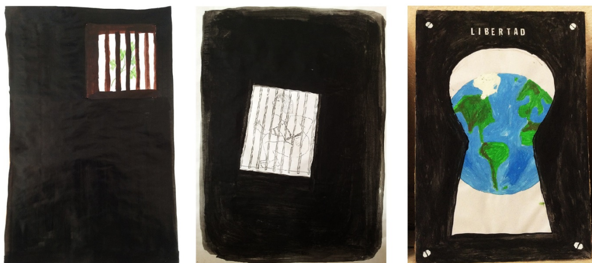
Figura 3. Oposiciones cromáticas y antítesis semánticas

Página Coco Cerrella. Taller en la cárcel, en https://coco.com.ar