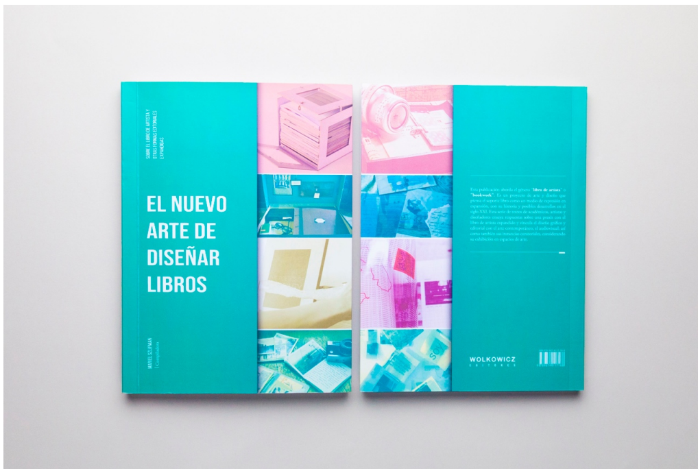
Figura 5. “El nuevo arte de diseñar libros”

El proyecto de la exposición incluyó el desarrollo de un sistema de identidad visual que articuló diferentes piezas de comunicación de uso público. El desarrollo del sistema tuvo como objetivo generar una identidad visual y comunicacional unificada para el espacio físico y virtual, articulando diferentes aspectos culturales de la muestra que contó con trece obras de diferentes artistas y otros eventos como performances, proyecciones, presentaciones y visitas guiadas por la exposición. El desarrollo del sistema implicó el diseño de: marca y logo; manual de identidad; diseño editorial de publicación; piezas gráficas como postales, folleto, afiches de sala, fichas de obra; e-flyers digitales; flyers para redes sociales; fotografía de sala y documentación de obra. 14