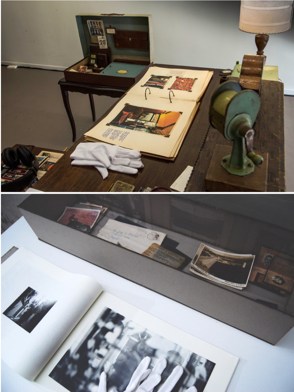
Figura 2. Documentación de las obras de Adosi y Potente