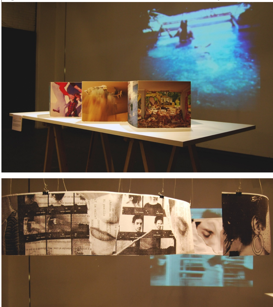
Figura 3. Documentación de las obras de Olivera y Pécora

en una mesa de montaje. Con los mismos materiales de archivo del film sobre su historia personal, la casa de su infancia y la figura de su padre, en El jardín era un bosque (2018) re-configura el guion original de la película para generar un nuevo relato y un montaje entre-imágenes. Las piezas, dispuestas de una forma sugerente, conforman un espacio arquitectónico y laberíntico. Una obra que deambula entre el autorretrato y el guion gráfico y que, en el espacio de la sala, se percibe con fragmentos reeditados de la película, permitiéndole al espectador realizar su propio montaje entre el espacio fílmico y el editorial (Figura 3).