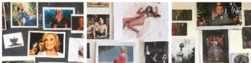
Fig. 1. Imágenes de tres pasajes del Atlas realizado en el Taller.

Esta presentación en modalidad de póster tiene como objetivo presentar un recorte del trabajo realizado en el proyecto de investigación PIA MyC-17, cuyo objeto de estudio son las tecnopoéticas del diseño audiovisual.