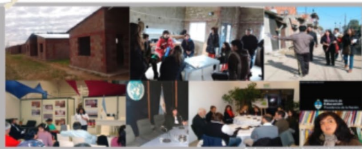
Actividades de extensión en sectores con conflictos socio-territoriales en vinculación con organizaciones intermedias y organismos gubernamentales.