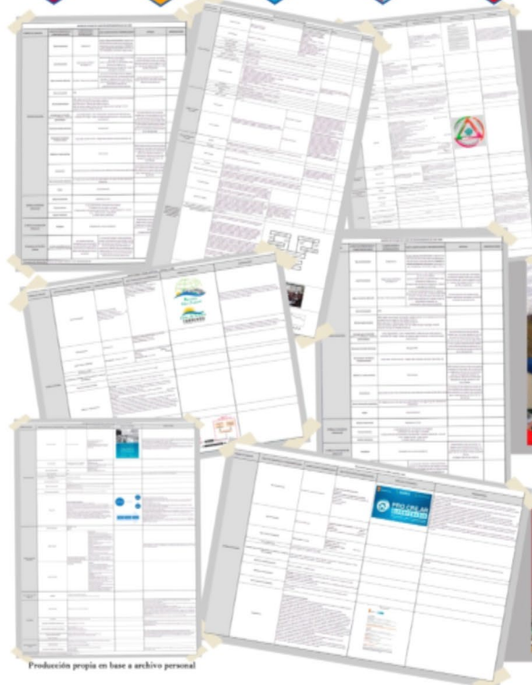
Producción propia en base a archivo personal

Mediante esta metodología, los inventarios condensan la información en un formato de cuadro de tipo "matriz de fichaje de casos", que incluye variables de análisis e imágenes que permiten visualizar de manera más expeditiva aquellas cuestiones que son centrales para el proyecto marco de trabajo y que atraviesan transversalmente a todas las líneas y sub-líneas de investigación.