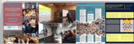
Producción y actualización de información empírica para estudios y trabajos académicos

Estas fichas contienen, entre otros aportes, imágenes referenciales fundamentales, que condensan información de manera sistematizada y sirven como insumo para estudios urbanos, y difusión y transferencia para la formulación de estrategias en determinados territorios.