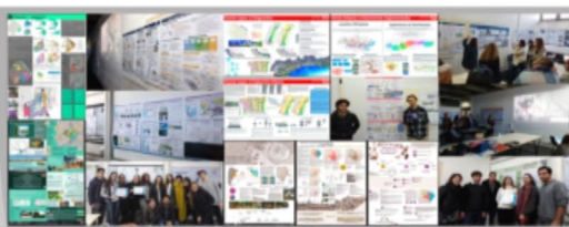
Simulación de aplicación de algunos instrumentos para la gestión urbana en recortes territoriales

El póster expone los insumos de trabajo surgidos de la imbricación del Proyecto de Investigación Ubacyt "Gestión Urbana Contemporánea y Justicia Socio-Espacial", con los Proyectos PIA 15 "Instrumentos de gestión urbana desde el enfoque del Derecho a la Ciudad. Bajada territorial en la Provincia de Buenos Aires" y PIA 13 "Las infraestructuras urbanas básicas como políticas de inclusión en los procesos de inclusión en la Región Metropolitana de Buenos Aires", con el trabajo académico de los equipos de la materia de grado Gestión Urbana Contemporánea (cátedra Szajnberg) de la carrera Arquitectura, y la asignatura de posgrado "Instrumentos de planificación y gestión urbanística para el desarrollo urbano" del Programa de Actualización Profesional de la Secretaría de Posgrado.