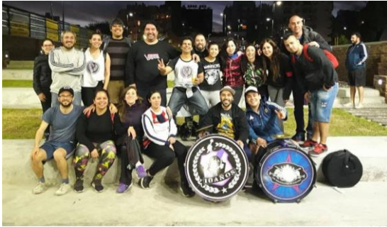
Figura 11: Ensayo nocturno de la Murga en el anfiteatro