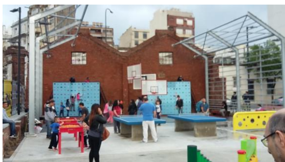
Figura 10: Área de juegos y deporte del Parque de la Estación, 2019

Podemos constatar adultos jugando con niños al ping pong, o al metegol, o adolescentes jugando al basket al lado de niños más pequeños en los aros más bajos. Jornadas de plantación con participación donde participan niños, adolescentes, adultos, adultos mayores todos juntos con el objetivo de mantener la vegetación del parque, generando un estrecho compromiso con el espacio público. Los espacios cambian en usos según el día y/o el horario donde los distintos usuarios resignifican el cada lugar. Es así que el playón se patina, de juega la pelota.