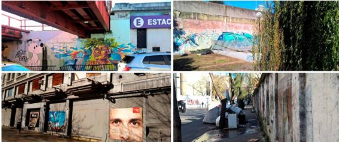
Figura 2: Relevamiento fotográfico previo a la intervención