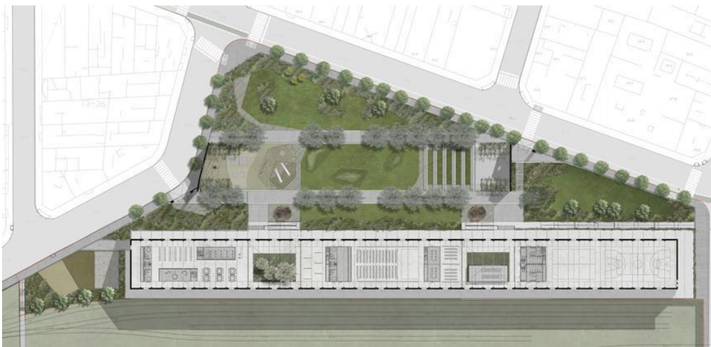
Figura 7: Planta Parque de la Estación

Fuente: Dirección de Innovación Urbana - GCBA