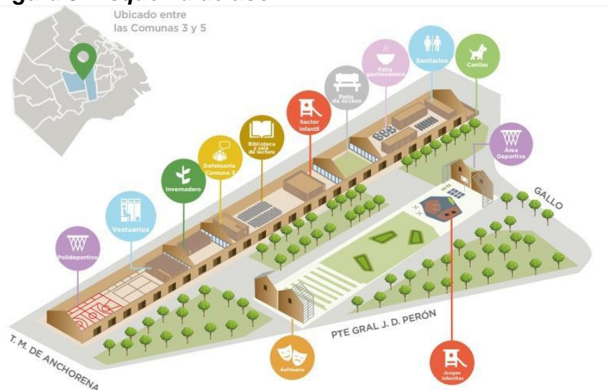
Figura 5: Esquema de uso