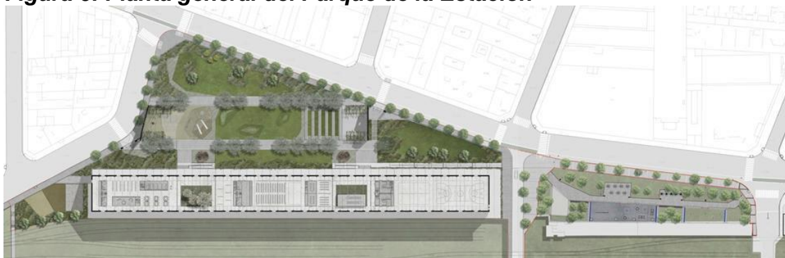
Figura 6: Planta general del Parque de la Estación