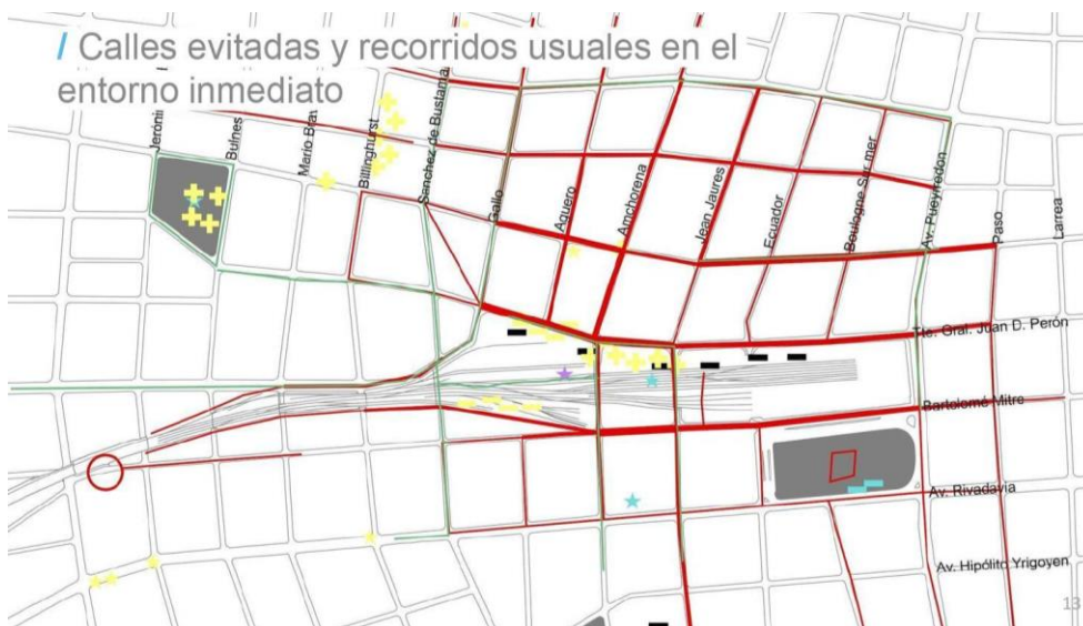
Figura 3: Mapeo calles evitadas y recorridos usuales en entorno inmediato