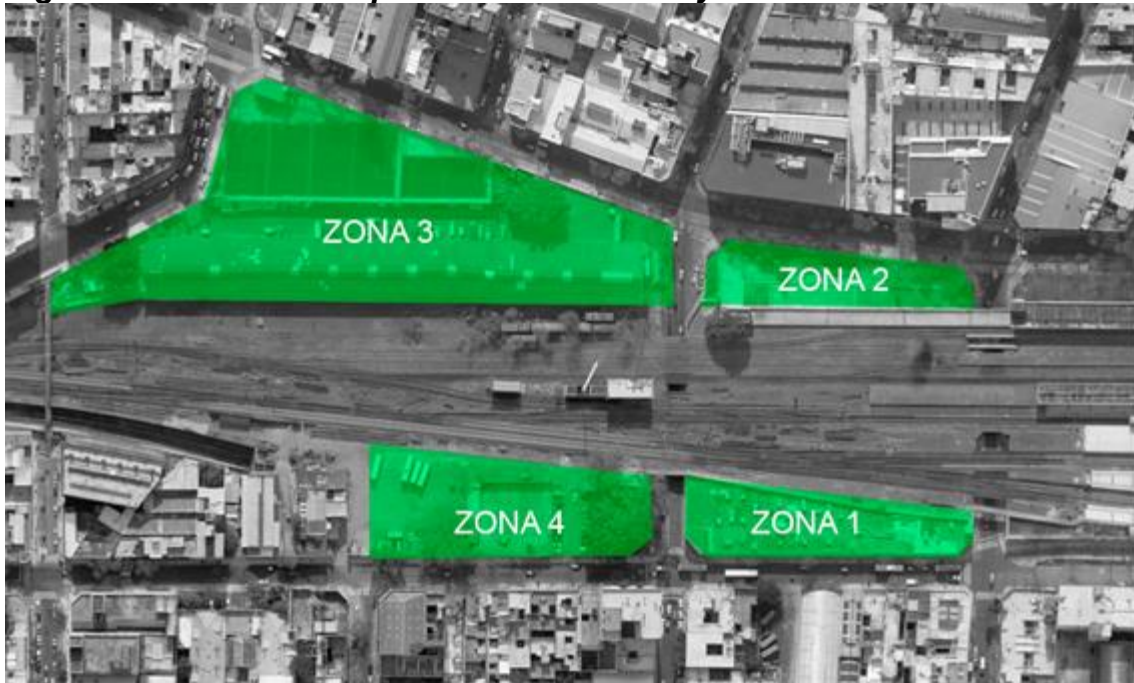
Figura 1: Zonas del Parque de la Estación. Ley 5734