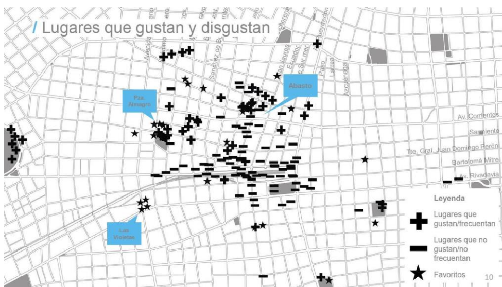
Figura 4: Lugares que gustan y disgustan