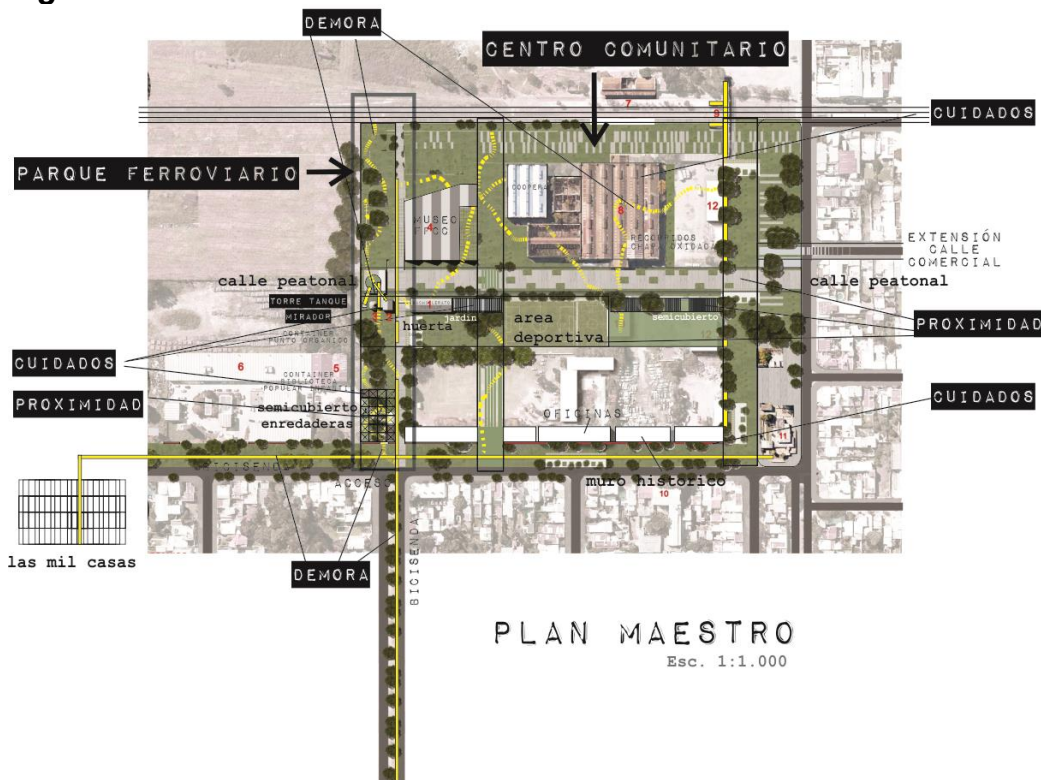
Figura 4: Plan Maestro: Polo comunitario en Tolosa