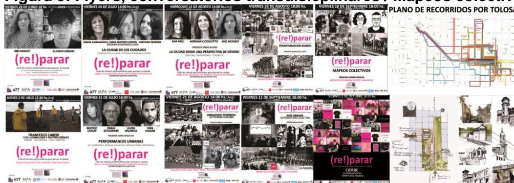
Figura 3: Flyers, conversatorios transdisciplinarios / Mapeos colectivos.