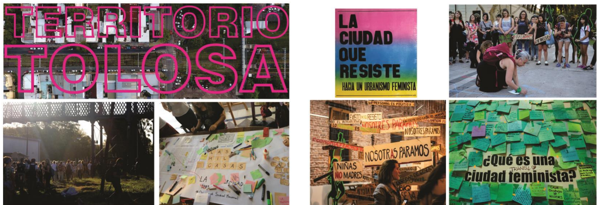
Figura 1: Colectivas Territorio Tolosa y La Ciudad Que Resiste.