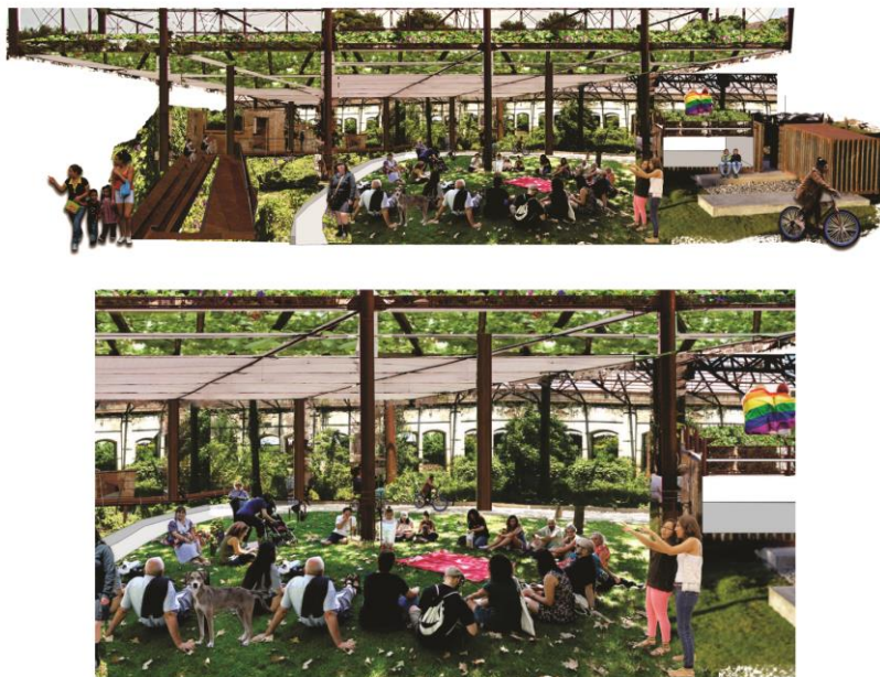
Figura 5: Escala de re-proyecto: Habitar situado. El collage como proyecto para la demora/proximidad/cuidados. Semicubierto de enredaderas.

Finalmente, para definir formalmente el proyecto se realizó un catálogo de piezas situadas que provenían de la información surgida en las escenas de habitar situado para dar medida y materialidad al re-proyecto.