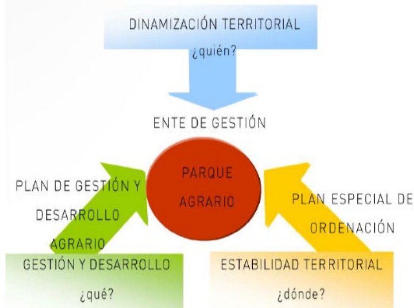
Figura 5: Esquema explicativo del Parque Agrario