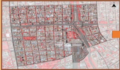
Polígono APH. En rojo vegetación

En el Código de Planeamiento Urbano (COU) se incluyen 54 Áreas de Protección Histórica (APH) que poseen significado patrimonial y, por ende, ameritan ser protegidos.