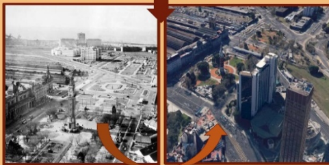
Zona Estación Retiro en c.1920 y en la actualidad

En octubre de 2003, la Quebrada de Humahuaca en la provincia de Jujuy, Argentina fue declarada por la UNESCO, "Paisaje Cultural de la Humanidad". La declaración señala Paisaje Cultural evolutivo viviente, vivo, que se manifiesta en una multiplicidad relevante de su cultura e historia, y los componentes de una diversidad de particularidades excepcionales, geográficas y sociales.