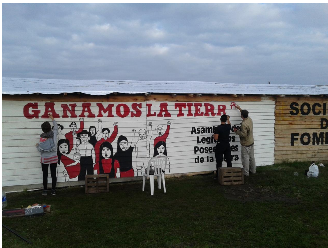
Figura 5 - Profesionales al servicio de la gente

A través de la experiencia "Abasto", los arquitectos hemos tenido una primera aproximación sobre "urbanismo", (un curso acelerado, y desde la "práctica"), ya que al haber una primera propuesta de "tierras" en el trazado general, y más adelante en la reubicación de áreas, en acuerdo a la cuestión hídrica, nos permitió abordar lo de Melchor Romero con un cierto bagaje de conocimiento.