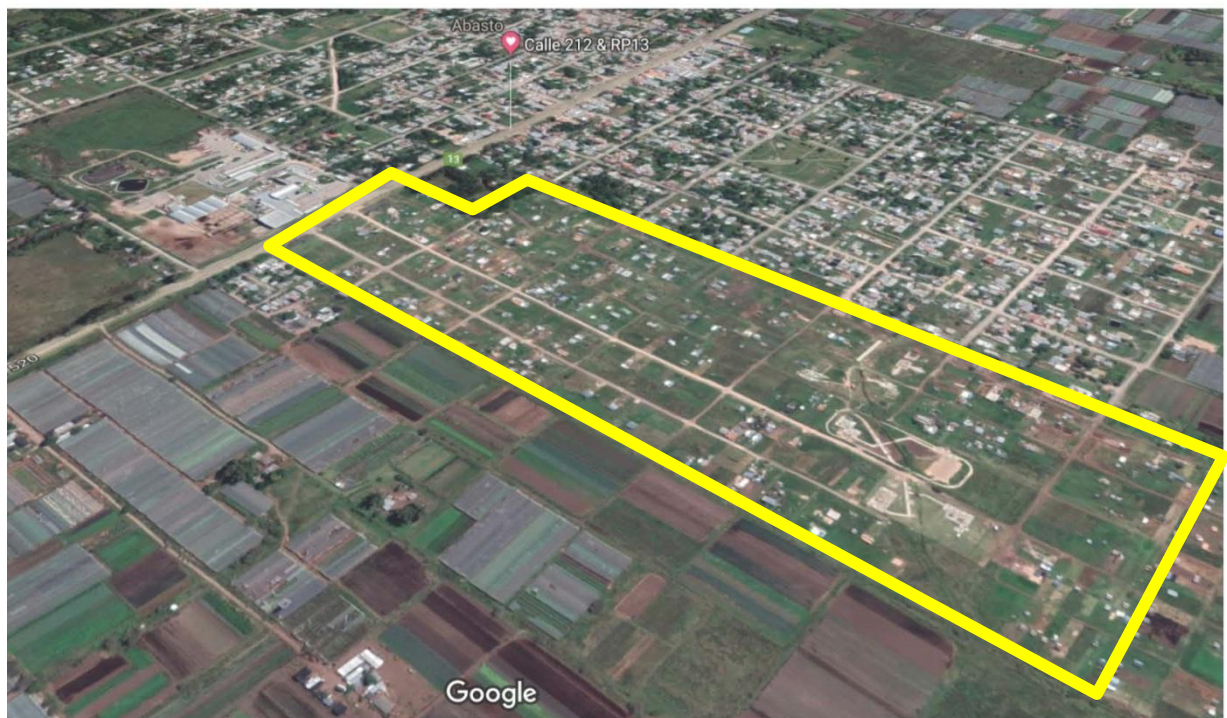
Figura 1- Google Earth- ubicación de la urbanización con el avance a 2019

Asimismo, la Provincia, a través de la Fiscalía de Estado, avanzó en el juicio expropiatorio, y le ha sido otorgada la posesión de los inmuebles, indispensable para llevar a cabo las obras de estudio, nivelación, mensura y posterior división de los lotes que serán la base de las viviendas familiares.