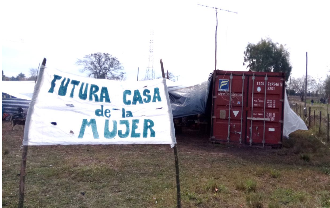
Figura 4 – Terramia nuevas urgencias

alternativas presentadas por alumnos del Taller TIP- FADU UBA e integrantes de Arq De A Pie.