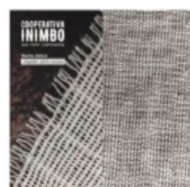
Vista de la Cooperativa Inimbo. Rama alcega.