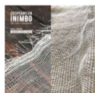
Vista de la Cooperativa Inimbo. Gasa.