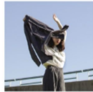
Aug. 2019. Conjunto parazon saco trama sobre telas de Algodón.