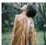
Tierra Fértil. Verano 2020. Chompa tejida a pelo de lana Merino.