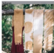
Tierra Fértil. Verano 2020. Camisero de mesa con impresiones botánicas y estampas con lana.

En la Argentina de los últimos años, la figura de la cooperativismo comienza a cobrar relevancia a la luz de la crisis socioeconómica del 2001. A partir de este contexto, iniciativas como Gráfica Chilavert o Textil Brukman, directamente vinculadas con rubros de diseño se han vuelto casos paradigmáticos de estas nuevas formas de organización. Estos nuevos modos de asociación se han extendido a numerosos puntos del país y han ofrecido canales alternativos frente a coyunturas adversas. Tal es el caso de la Cooperativa de Producción y Consumo Inimbo, cuyo caso resulta útil para abordar el objetivo del presente póster: analizar el rol-impacto del diseño entendido como una herramienta que permite pensar procedimientos e instrumentos que colaboren con el desarrollo de las cooperativas