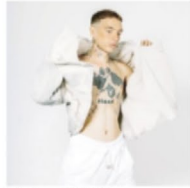
Chaco. Campaña Inimbo 2020.