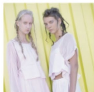
Chaco. Verano 2019. Reramas y parazon hechos con espiga de.