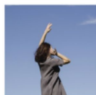
Aug. 2019. Tejido en trama sobre telas semiindustriales con Algodón.