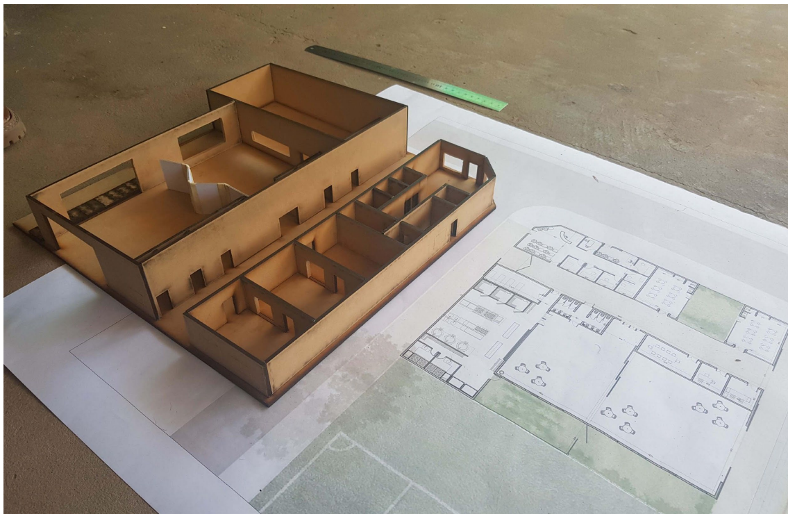
Figura 5: Presentación del Pre-Proyecto de Centro Comunitario

Terminamos la Tercera Jornada visitando nuevamente con los vecinos el terreno del futuro Centro Comunitario. Cerrando allí la primera etapa de trabajo.