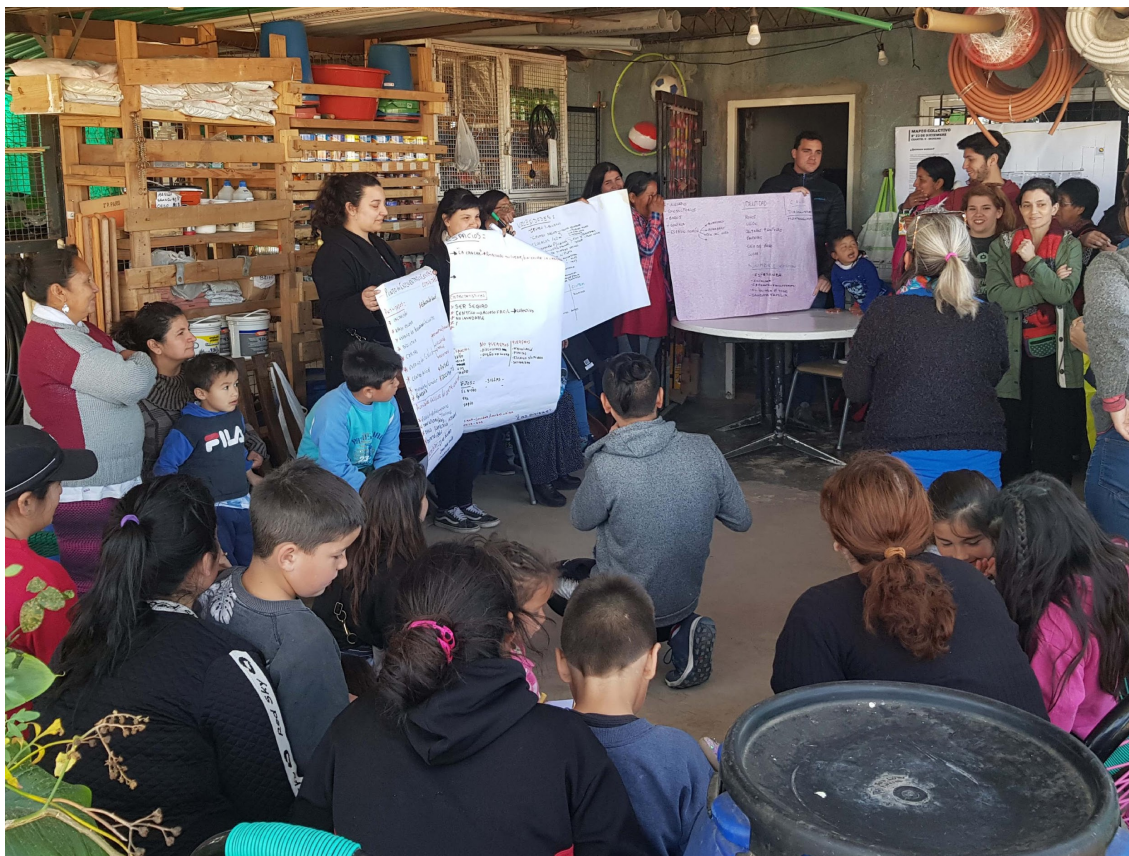
Figura 3: Puesta en común. Primera Jornada Participativa.