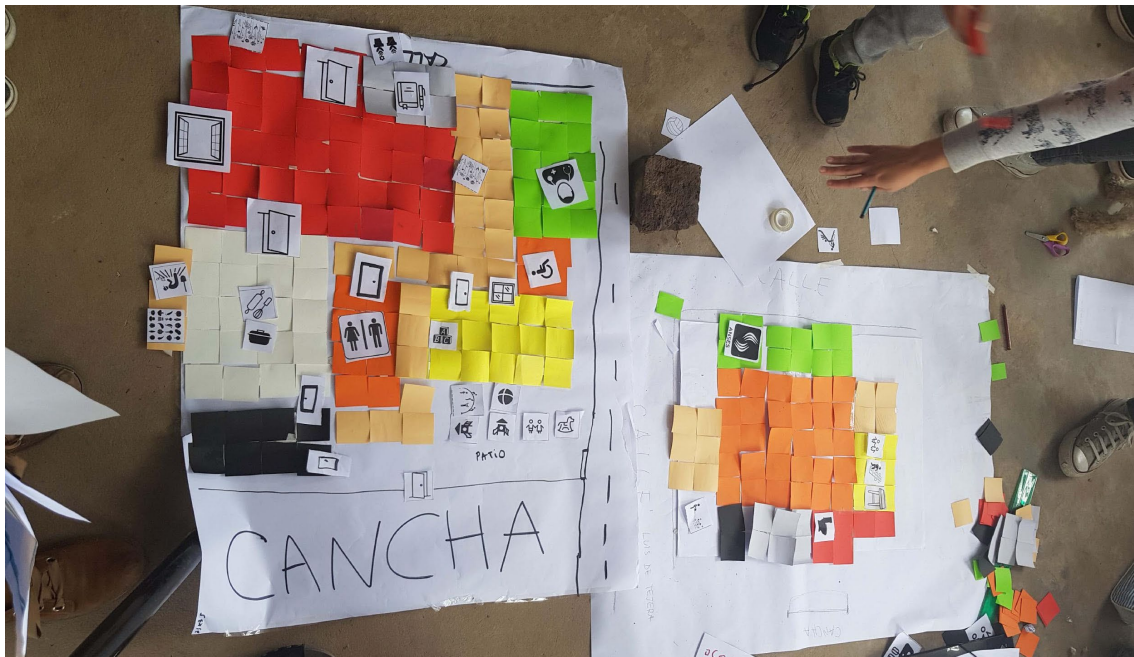
Figura 4: Dispositivos para la Segunda Jornada Participativa