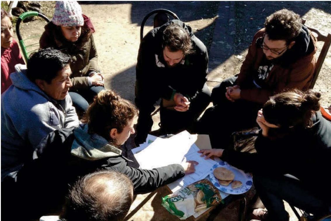
Figura 2: Equipo de estudiantes trabajando con vecinos en su vivienda