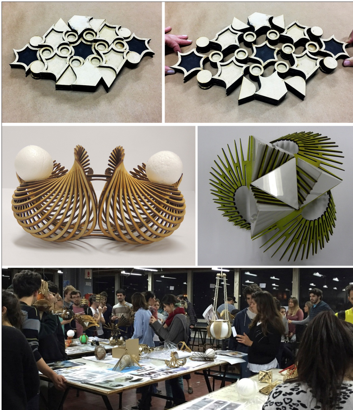
Figura 1. Trabajos de estudiantes de Morfología: modelo de tramas expansibles (cerrada y abierta) y de Morfología Especial 2: Diseño de contenedores / exhibidores por flexibilización de placas rígidas. Muestra de los trabajos el día de la entrega en el taller.

Asimismo, para contribuir a su difusión, en el año 2015 dictamos cursos en la Universidad de la República, Uruguay, y en la Universidad Autónoma de Occidente, Colombia, para estudiantes de grado y para docentes. Estas experiencias de taller nos han permitido verificar los conocimientos construidos en la investigación y formular preguntas, que abrieron nuevas instancias de exploración. Comprobamos