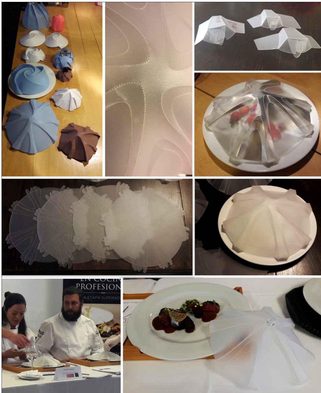
Figura 5. Desarrollos preliminares. Detalles y pruebas de encastramientos y de transparencia en diferentes materiales. Presentación en el concurso.

representaba con los pliegues, una abstracción de ramas de árboles. El desarrollo del producto se basó en maquetas de estudio (Figura 5), primero en cartulina y luego en plástico. Se estudiaron diferentes representaciones de las ramas y diversos encastramientos para los sectores que debían mantenerse en tensión para conservar la forma deseada.