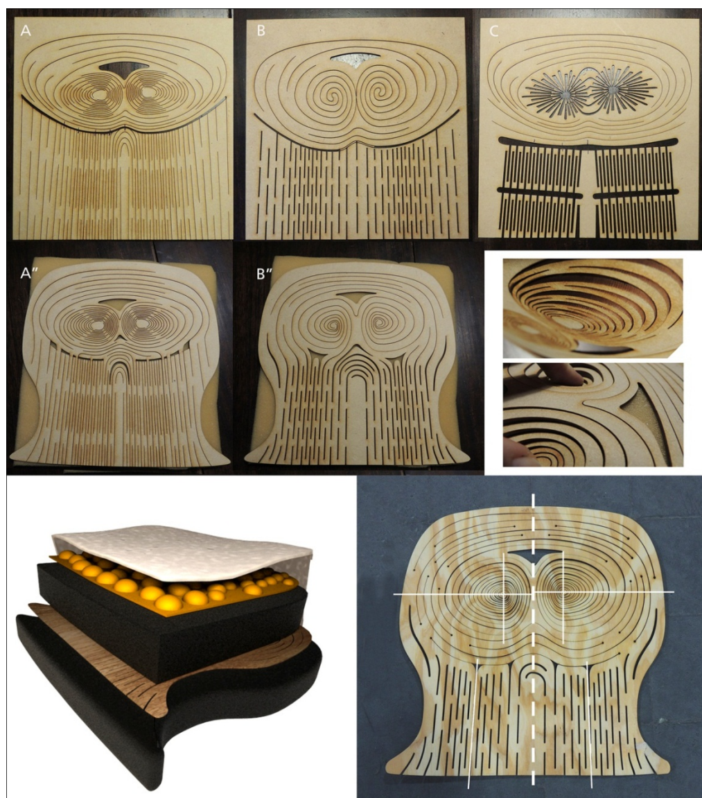
Figura 3. Proceso de desarrollo de alternativas de la placa separadora, estructura de la propuesta y corte final.

El patrón de corte no responde a una organización isométrica sino que se adecúa a las particularidades del usuario. Las tecnologías de fabricación digital, tales como el corte por láser o router, son particularmente eficientes para estos productos personalizados. Una vez que el producto genérico se resuelve, pueden realizarse todas las modificaciones particulares fácilmente. La morfología cumple un rol fundamental en estas adaptaciones, ya que el conocimiento de los atributos y comportamientos de los diferentes materiales- considerando su forma y la posibilidad de alterar sus propiedades por intervenciones en su configuración- constituyen un recurso valioso.