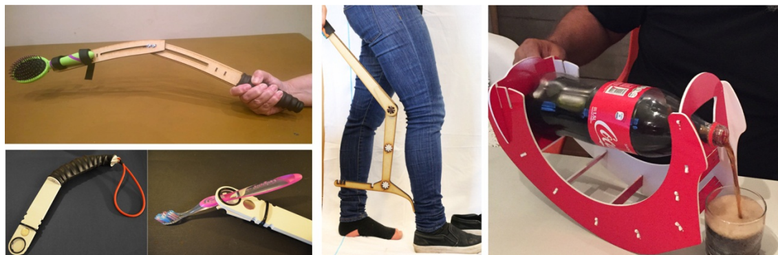
Figura 2: Productos de apoyo desarrollados por el grupo de investigación: brazo extensor articulado y fijo, calzador, servidor de bebidas.

En agosto de 2017 se realizó el III Encuentro Latinoamericano de FOP, en el marco del cual organizamos el Workshop: Herramientas para la vida independiente. Durante esta jornada, pudimos tener un intercambio directo e intenso con las personas afectadas y sus familias. Esto fue de gran utilidad para recolectar información acerca de necesidades que no son resueltas por los productos de apoyo accesibles económica y/o localmente.