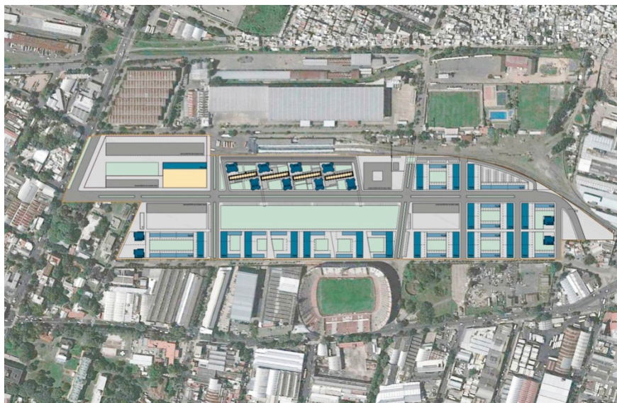
Ilustración 4: Desarrollo Urbanístico PROCREAR Estación Buenos Aires