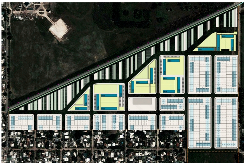
Ilustración 3: Desarrollo Urbanístico PROCREAR Itzaingó – Elaboración propia