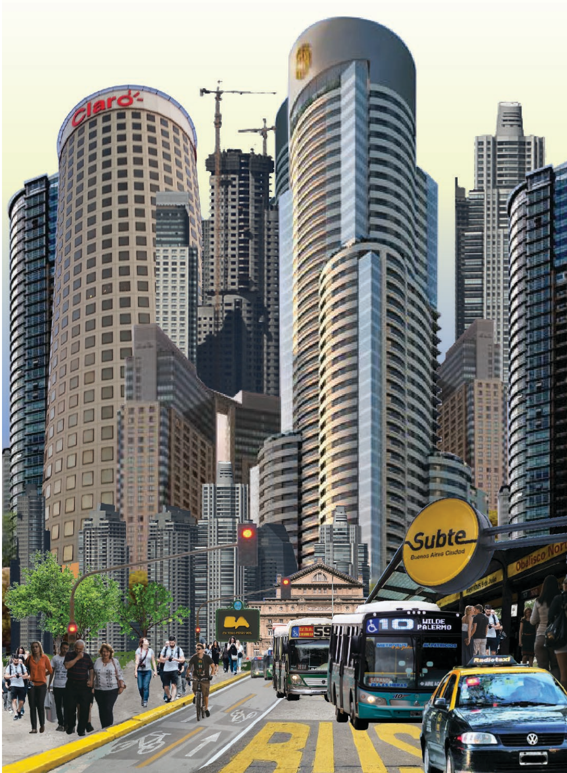
9-Imagen 5. Ilustración imaginario. Resultado de encuesta realizada para las presentes Jornadas como parte del proyecto de investigación Identidad Urbana. Procesos con sede en el IEH y cátedra Teoría del Habitar, FADU-UBA.