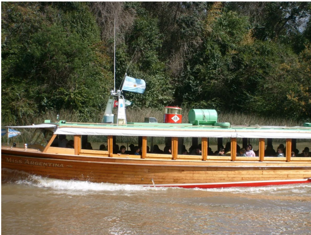
Figura 2. Lanchas colectivas utilizadas por turistas y locales. 6

Los turistas circulan por un espacio que se encuentra previamente transformado para ellos, dentro del plan esto se ve en espacios públicos de disfrute local y turístico, pasarelas de observación del ambiente y servicios de transporte diferenciados. (Figura 2)