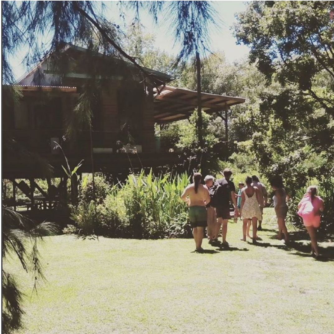
Figura 1. Casa en palafitos Delta de Tigre.