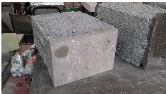
Fig 3. Eco-bloques terminados

El aprovechamiento de residuos, como las eco botellas insertadas en un eco bloque, está siendo investigada y ensayado en el laboratorio del CEP y en conjunto con una Cooperativa de General Rodríguez, que ya está aplicando varios de estos desarrollos, en merenderos y construcciones insertadas en el municipio, así como también el mejoramiento de viviendas de sus propios integrantes y vecinos.