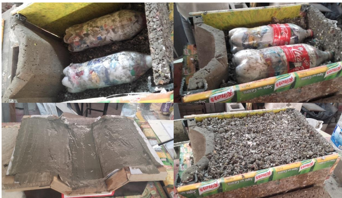
Fig 2 Laterales como encofrado perdido