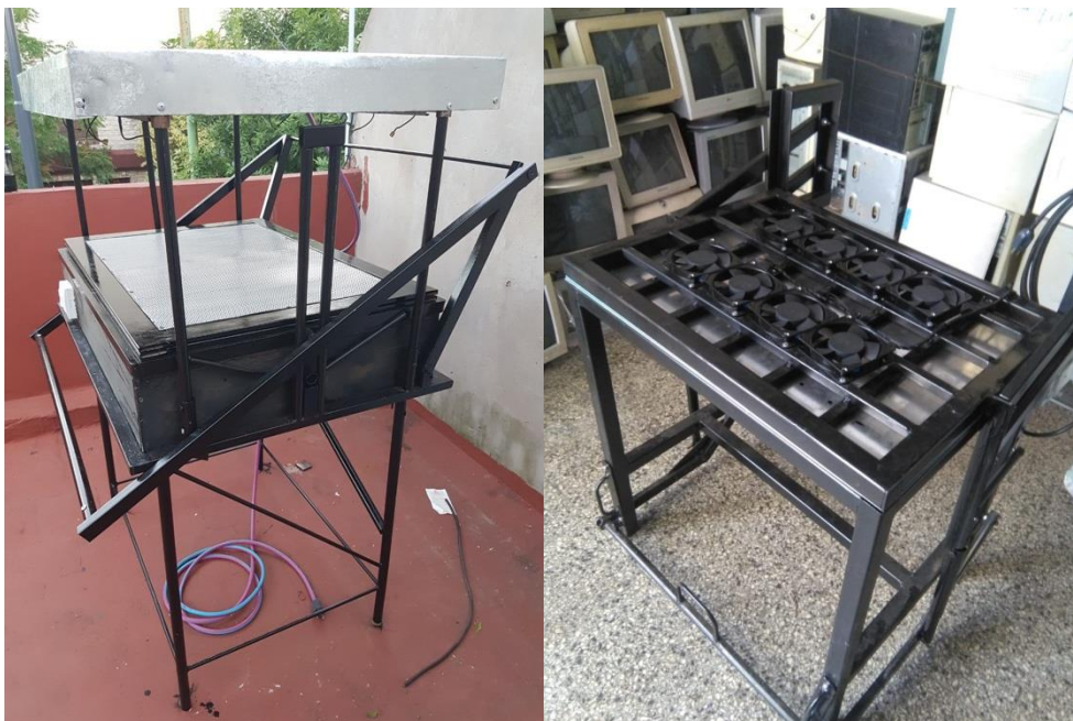
Fig.4- Termoformadora Terminka y Prensa fría

El departamento de investigación de Plásticos del CEP investiga desde hace años cómo darle soluciones de reciclado transformación y producción a estos materiales. En este ejercicio, cuyas investigaciones fueron explicadas en otros encuentros de Jornadas anteriores, se ha ampliado a distintas maquinarias de uso y reparación simple (Figura 6), para que las cooperativas puedan seguir ampliando su producción así está la Terminka que es una termoformadora que puede ser hecha por cualquier herrero y reparada por cualquier persona con conocimientos básicos de electricidad, está pensada para un uso mínimo de energía y con alternativas de termoformado. A esto se agrega una máquina que completa el proceso de prensado. De modo que se diseñó una prensa fría mediante la incorporación de distintas tecnologías mecánicas y de computación, que mejora y acelera el secado de placas de plástico reciclado que de lo contrario llegarían a su estabilidad recién a las 24 horas retrasando mucho los tiempos de producción. De esta forma se aceleran los procesos con bajo uso de energía y mejores técnicas de producción.