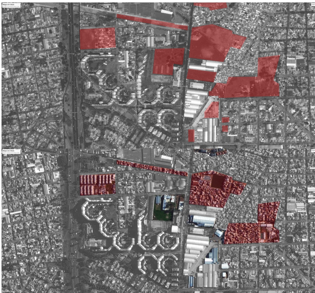
Figura 3. Imagen de elaboración propia sobre la base del Google earth

Dentro del sector en el que se inserta Piedrabuena, se observan grandes transformaciones en espacios vacíos, donde la forma que ésta adquiere da cuenta del crecimiento del hábitat informal contiguo al barrio (Villa 15). También se identifican transformaciones de grandes cubiertas, que estarían hablando de la ampliación de la