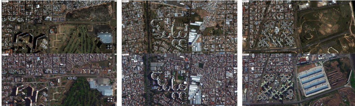
Figura 1. Imágenes tomadas desde Google earth

Estos fragmentos de imágenes de cada barrio, tomadas desde Google Earth en dos momentos distintos (año 2000 para la faja superior y año 2017 para las inferiores) y a una misma altura del ojo (1.52km), intentan, por un lado, insertar en la misma escala a los conjuntos dentro de una porción de territorio, y por el otro, identificar que en determinado proceso temporal (en este caso 17 años) se producen diversas transformaciones urbanas/arquitectónicas.