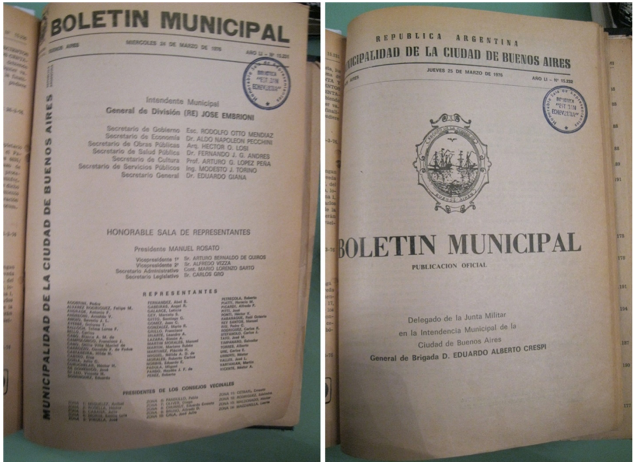
Figura 4. ¿Cambios en el Boletín Municipal? A la izquierda se puede observar la carátula del Boletín del día 24 de marzo de 1976. A la derecha la del 25 de Marzo de 1976, al día siguiente de golpe de estado. Disponible en el CEDOM (Centro de Documentación Municipal). (Fotografía de las autoras).