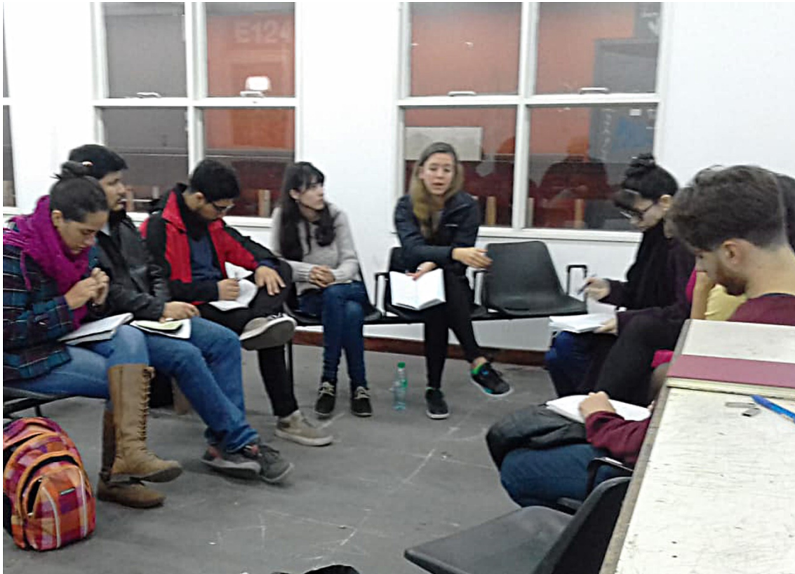
Figura 1. El dictado del seminario, junio de 2018.