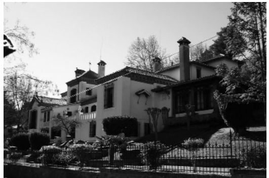
Figura 4: El Paraíso, exterior. Fue la casa del escritor Manuel Mujica Láinez. Actualmente es un museo.