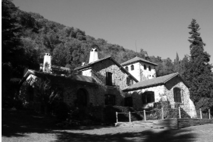
Figura 6: Toledo. Exterior. Actualmente funciona como hostel.