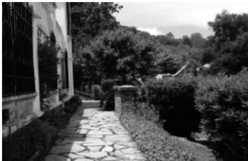
Figura 7: Jardines de El Paraiso.