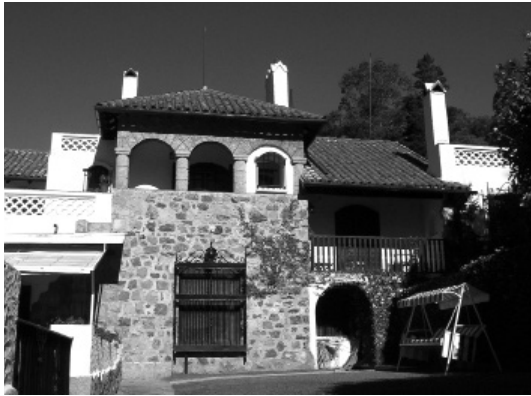
Figura 1: Sevilla exterior. Actualmente funciona como Hotel Boutique.