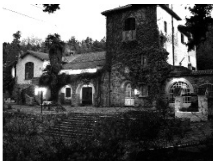
Figura 5: El Olimpo.