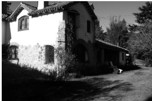
Figura 3: Chalet La Gitanilla, casa personal de Dourge.